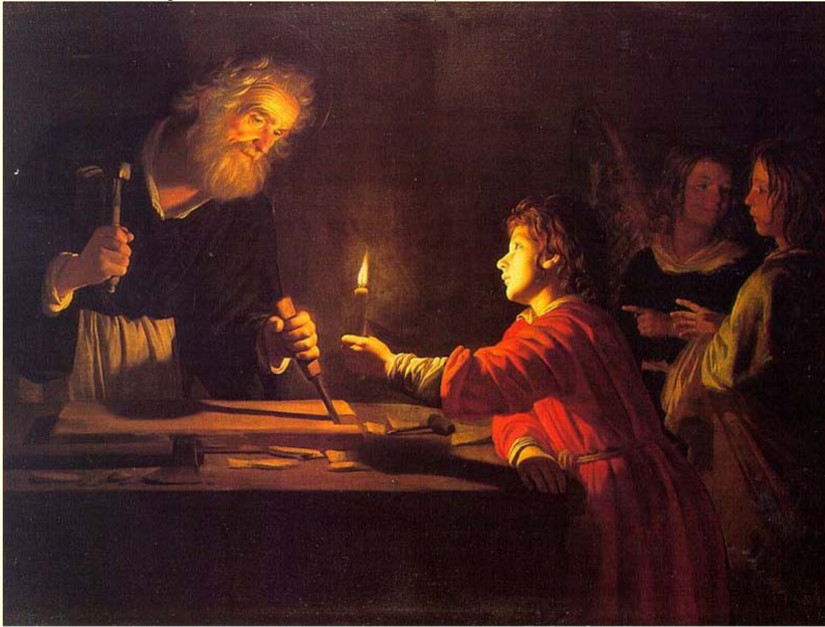
Gerrit van Honthorst, Il Bambino Gesù nella bottega di S. Giuseppe , 1620, Hermitage, San Pietroburgo

Noi, abituati a ragionare 'terra, terra' ... da poveri uomini!