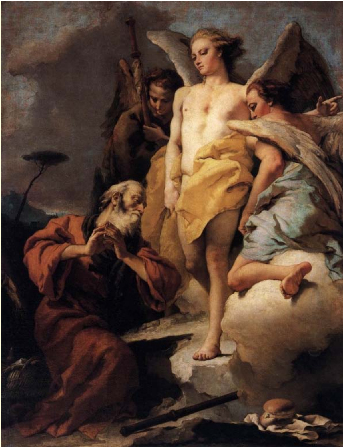
LE IMMAGINI: ANNUNCIAZIONE - Leonardo - Firenze Apparizione dei tre Angeli ad Abramo - Giovanni Battista Tiepolo